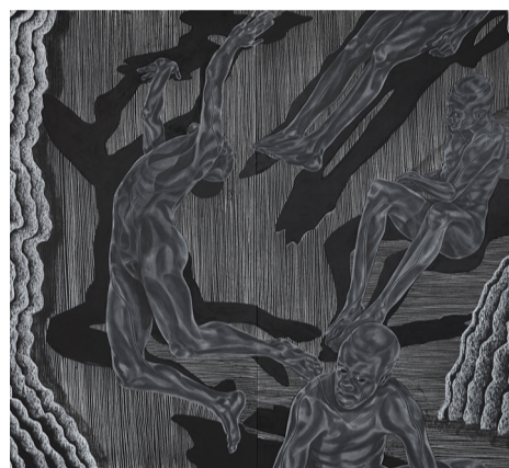
Nyerhvervelser og donationer (Toyin Ojih Odutola)

Læs om udstillingerne på www.holstebrokunstmuseum.dk