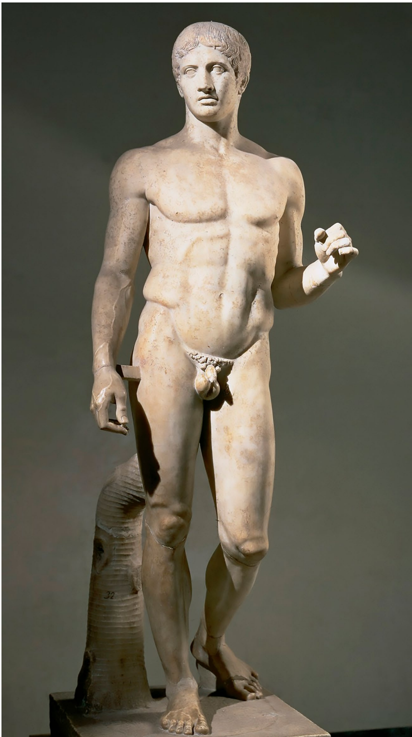
Spjdbæreren er en af de mest kendte skulpturer fra antikken. Den er lavet af billedhuggeren Polyklet, ca. år 450-440 f.Kr.