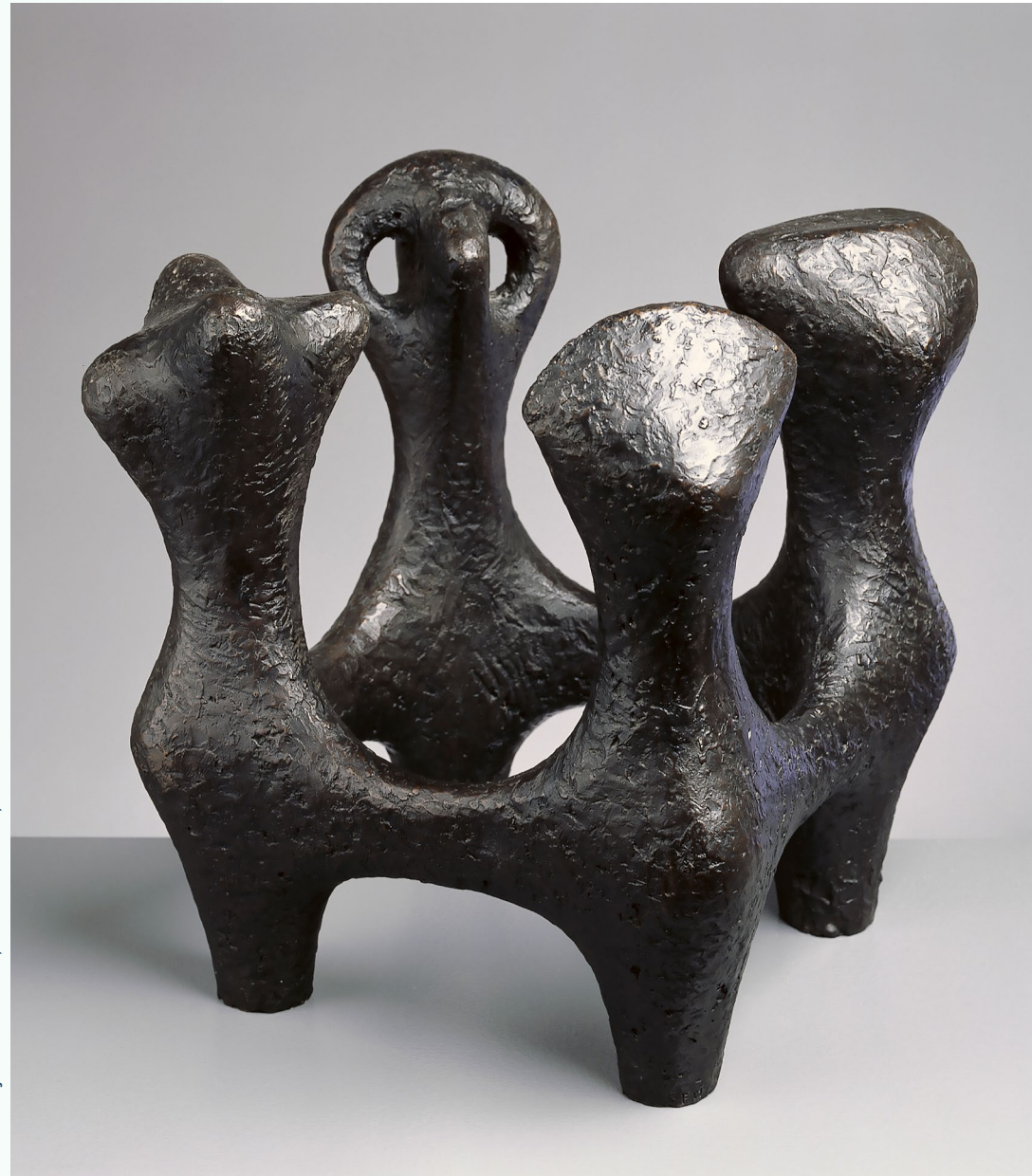
Sonja Ferlov Mancoba, De fire kontinenter, 1978

Præsenter jeres essays for hinanden, og tag en snak om, hvordan I tror, Coronakrisen vil sætte aftryk på kulturen og kunsten fremover.