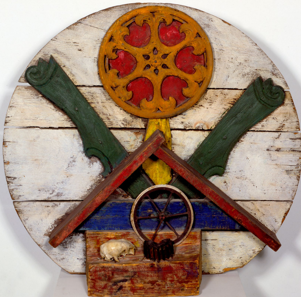
Henry Heerup, Livet og døden, 1943-47.