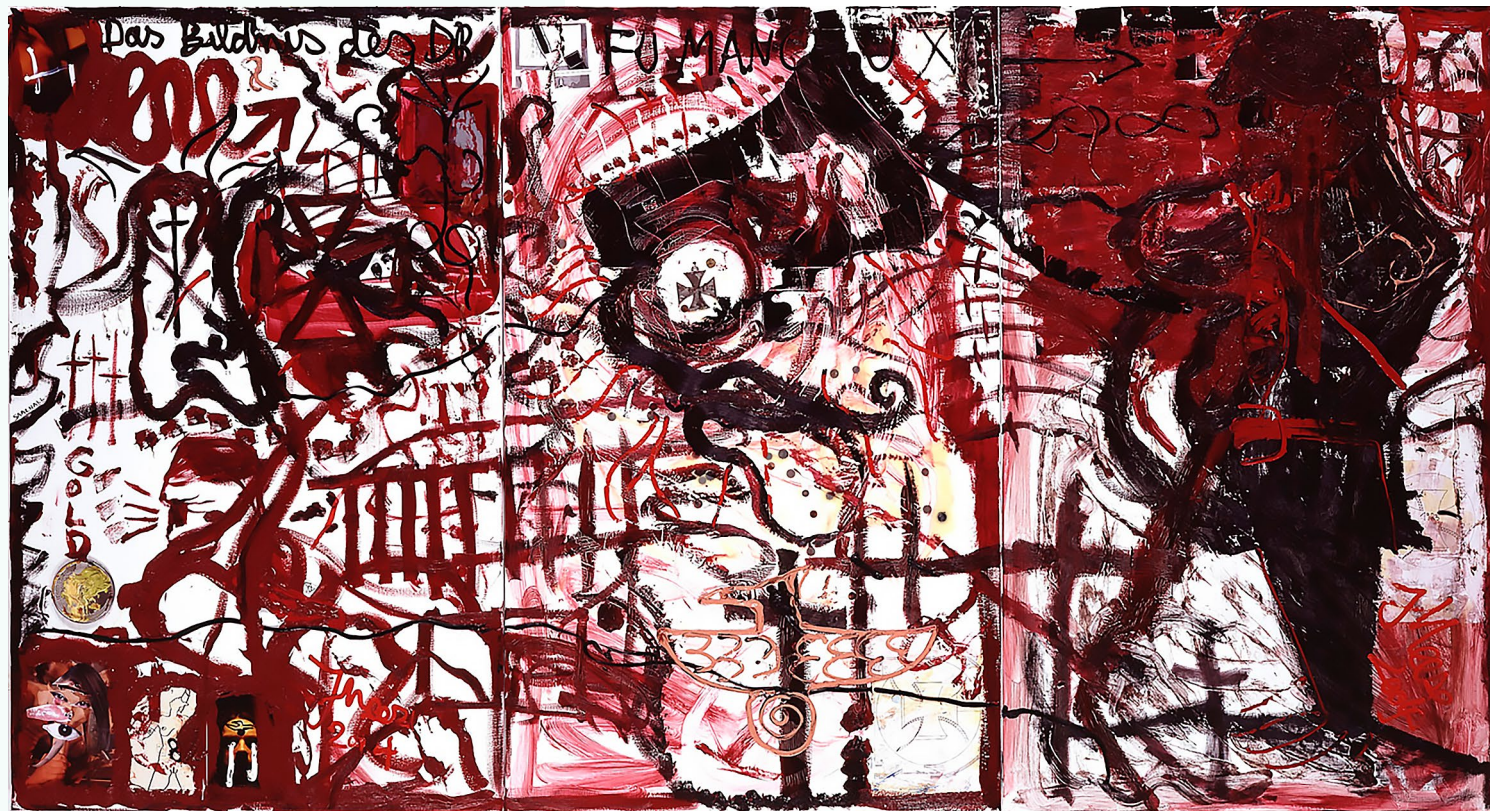
Jonathan Meese, Das Bildnis des Dr. Fu Manchu im Namen der Ordensburg Commodityssys , 2004

Selvom værket er lavet lang tid efter 2. Verdenskrig, indeholder det flere referencer til krigen.