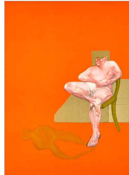
Francis Bacon, Triptyque , 1983