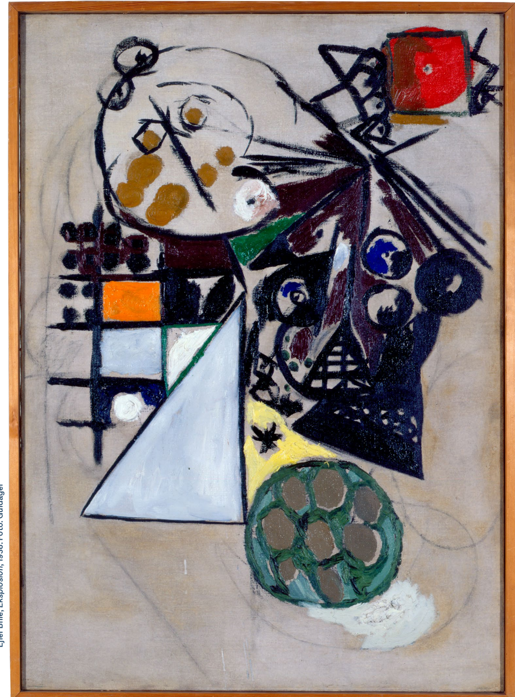
Ejler Bille, Ekspllosion , 1938. Foto: Guldager

Krigsårenes kaotiske tilstand er tydeligt til stede i mange af kunstnernes værker. Farverne ændrer sig, og penselstrøgene er påført med vildskab og raseri. Se blot på Ejler Billes værk Ekspllosion , som kan findes i kunstmuseets udstillingssale.