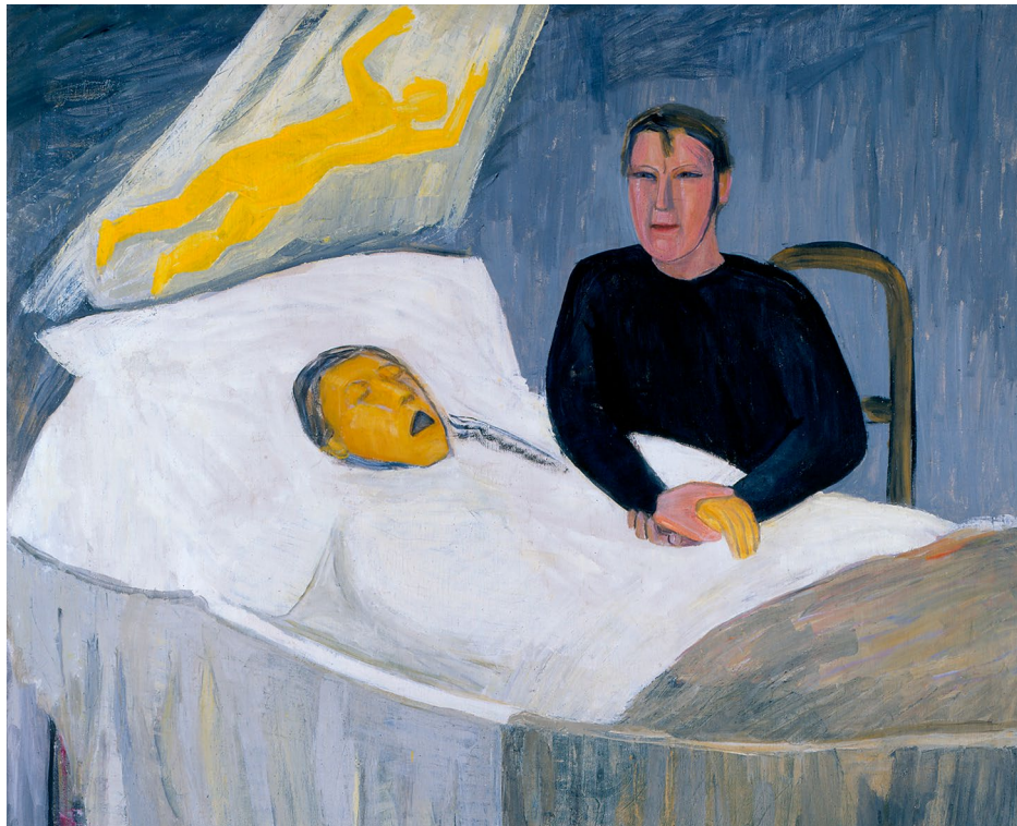
Olivia Holm-Møller, Et dødsleje, 1929.

Med krigens ophør fulgte altså både ruiner samt økonomiske og menneskelige kriser og tab, men også en mulighed for nybrud og frisættelse af mennesket og kunsten.