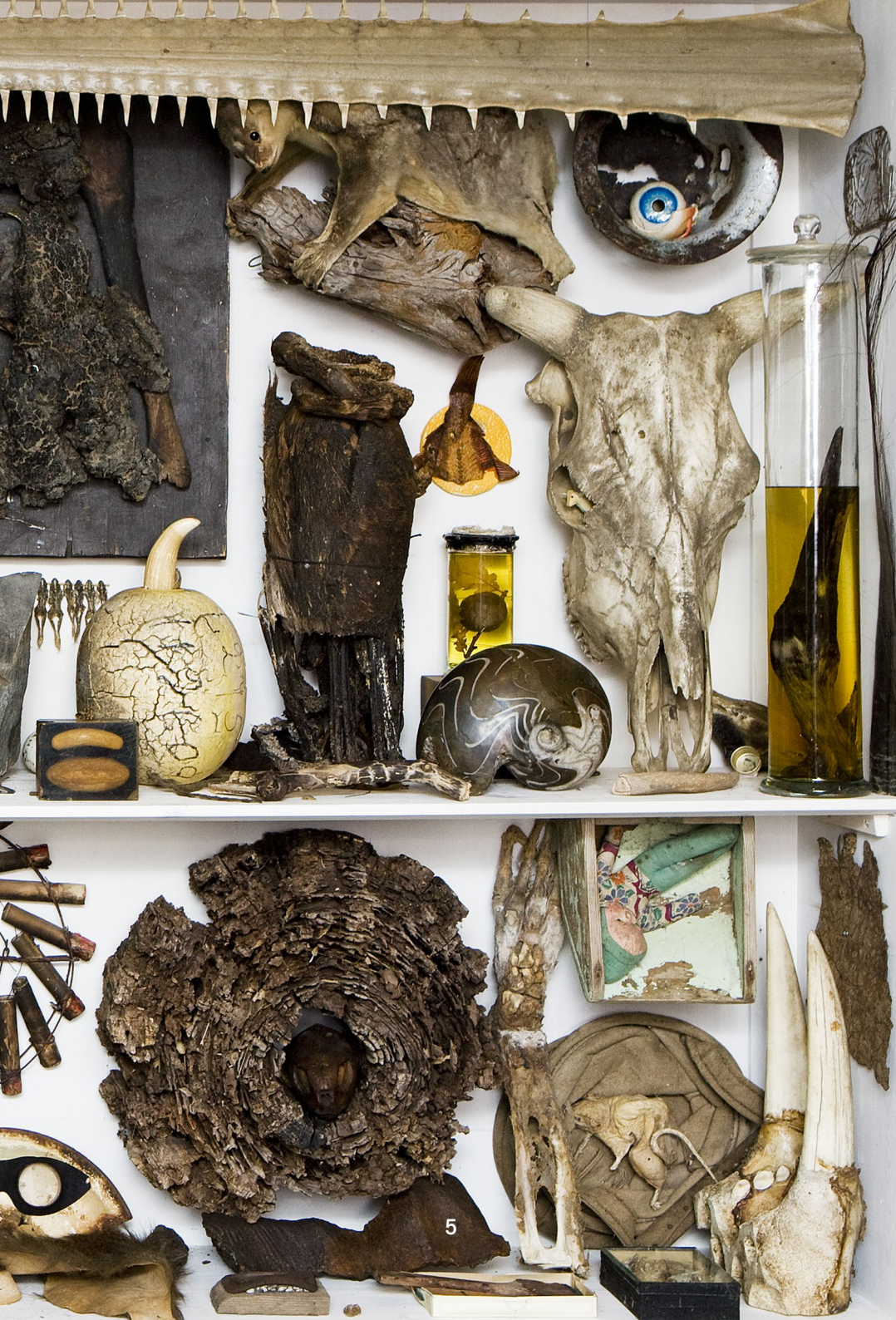
John Olsen , 'Undrekammer' [detalje], 2001-10.