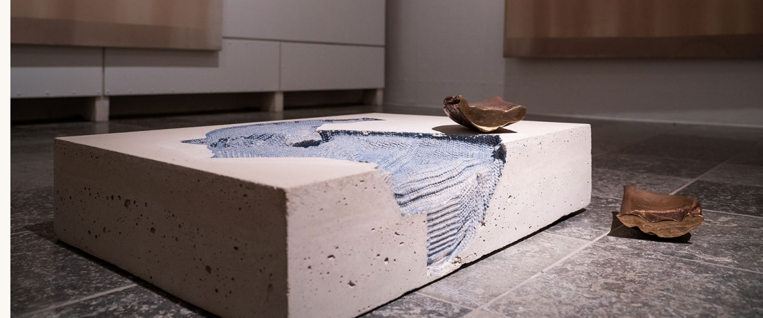
Marie Lund, 'Torso' og 'Hand Full', 2014.