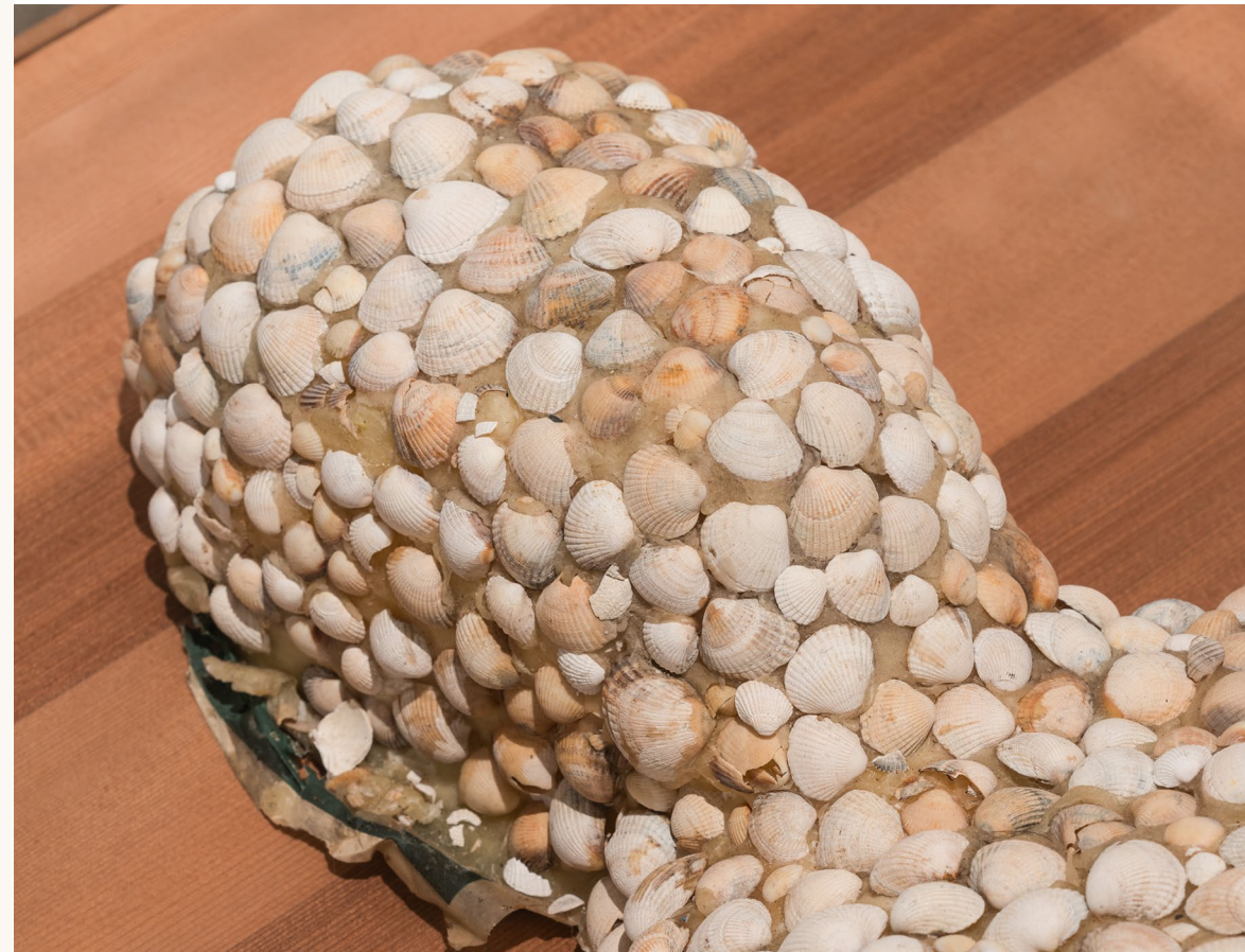
Emil Westman Hertz, 'Skalmand' [detalje], 2012.