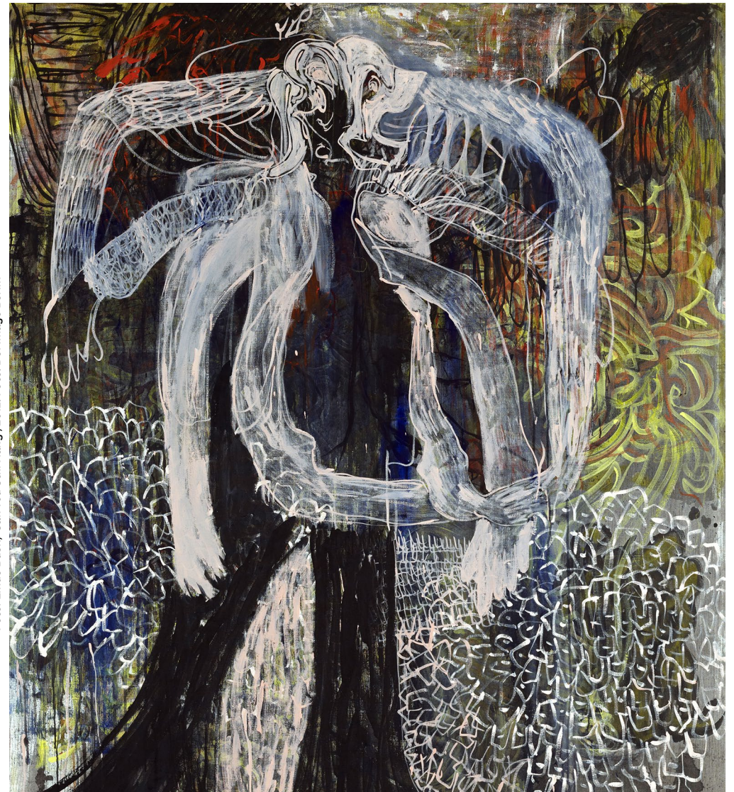
Peter Linde Busk, 'Can You Still Hang', 2012.

En måde at komme 'under huden' på de enkelte værker, og hermed kunstnerens tanker og intentioner bag, er at inddrage de kropslige og emotionelle fornemmelser for værket, som kan igangsætte en mere umiddelbar samtale.